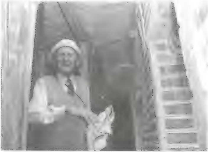
لوير داخل المقبرة الجنوبية